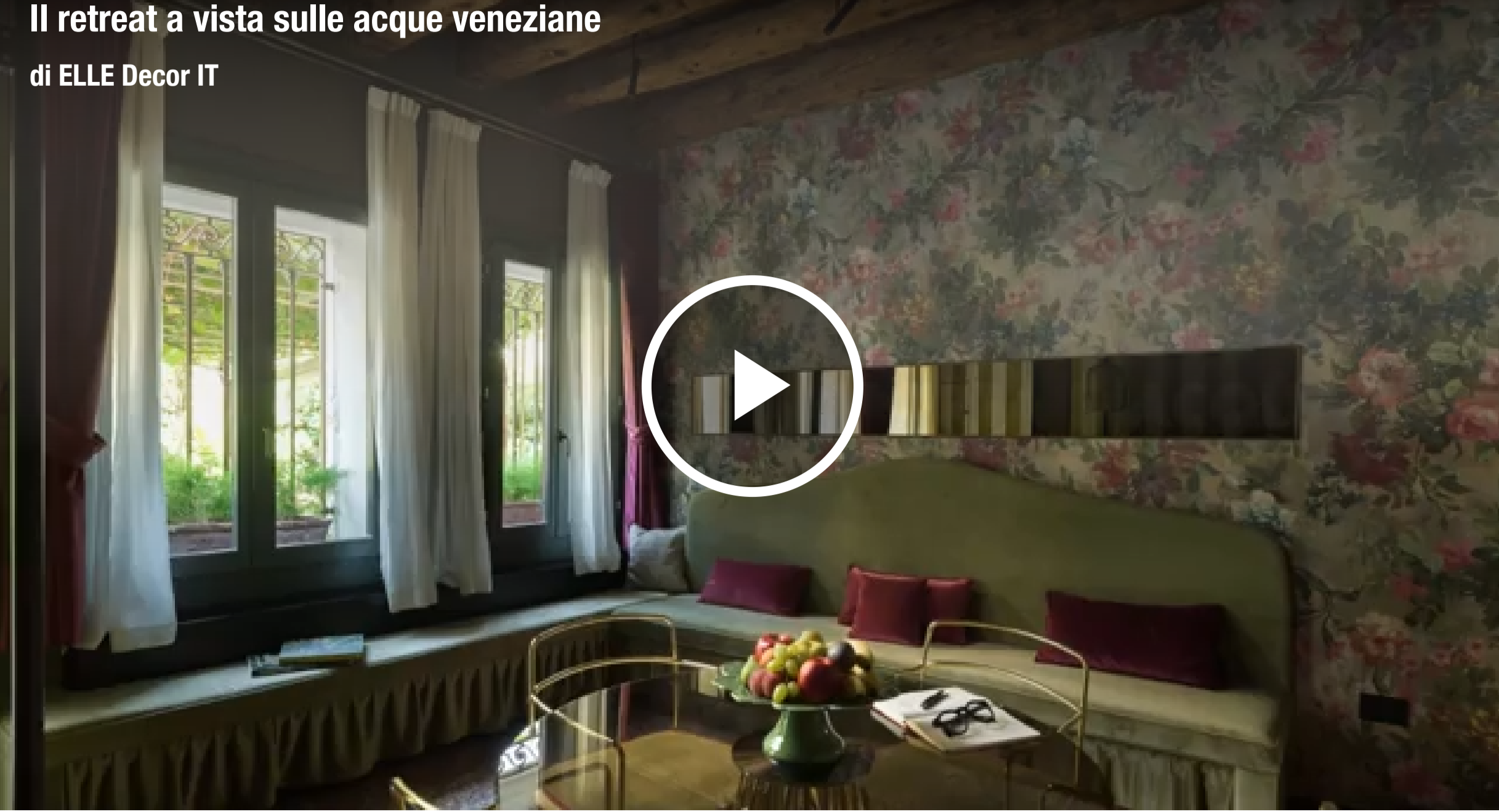
Il retreat a vista sulle acque veneziane di ELLE Decor IT

DI FEDERICA PRESUTTO / PUBBLICATO: 14/05/2023